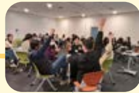
アイスブレイクの様子